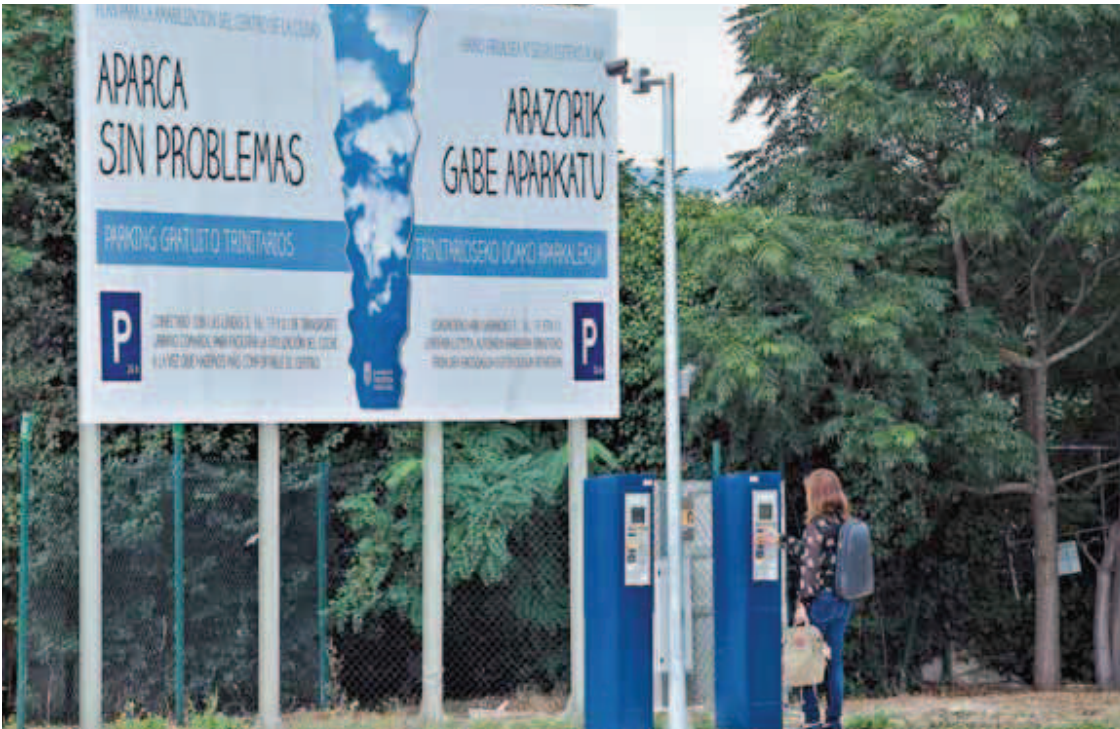
Una mujer recoge el ticket que intercambiará en la villavesa por un billete al centro de Pamplona.