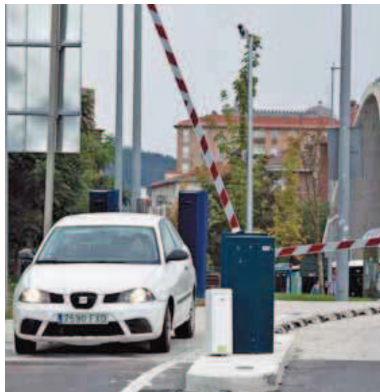
La entrada de vehículos al recinto no obliga a usar el autobús.