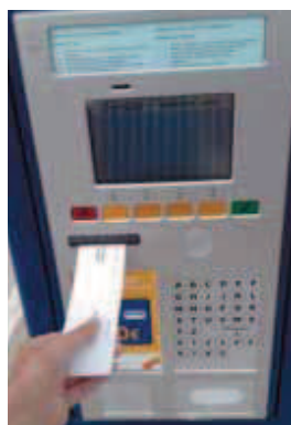
La máquina expende el ticket.